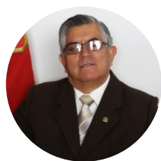
Director: Dr. Jesús David Sánchez Marín